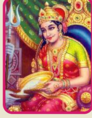
॥ શ્રી અન્નપૂર્ણા મા ॥