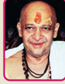
॥ પૂ. શ્રી ડોંગરેજી મહારાજ ॥